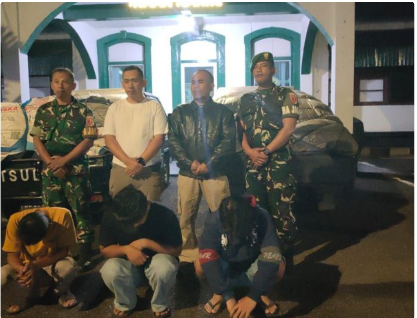
Kodim 0304/Agam Amankan Tiga Pelaku Penjualan Pupuk Bersubsidi di Gadut, Satu Orang Kabur

Bukittinggi — Aparat Kodim 0304/Agam berhasil mengamankan tiga orang terduga pelaku penyalahgunaan pupuk bersubsidi di wilayah Gadut, Agam Sumatera Barat, Jumat (17/04/2026) sekitar pukul 17.00 WIB.